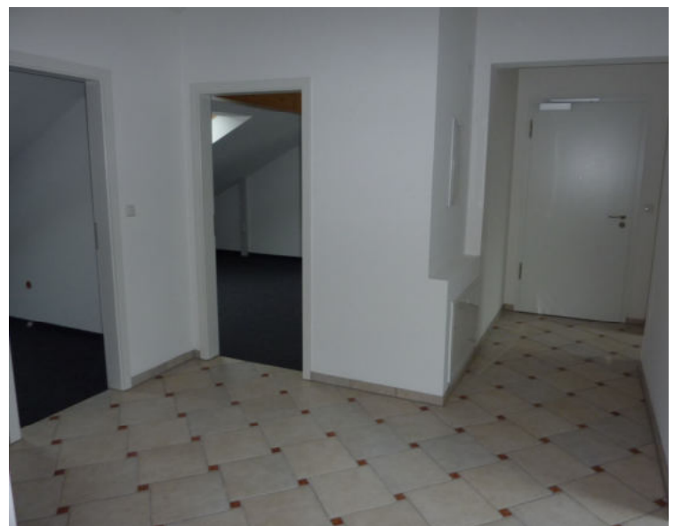
Flur / Eingangsbereich