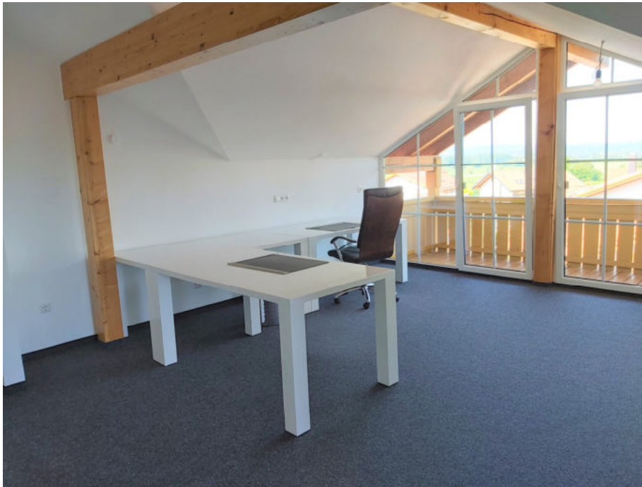
Büroraum (mit Anschlüssen für eine Küchenzeile)