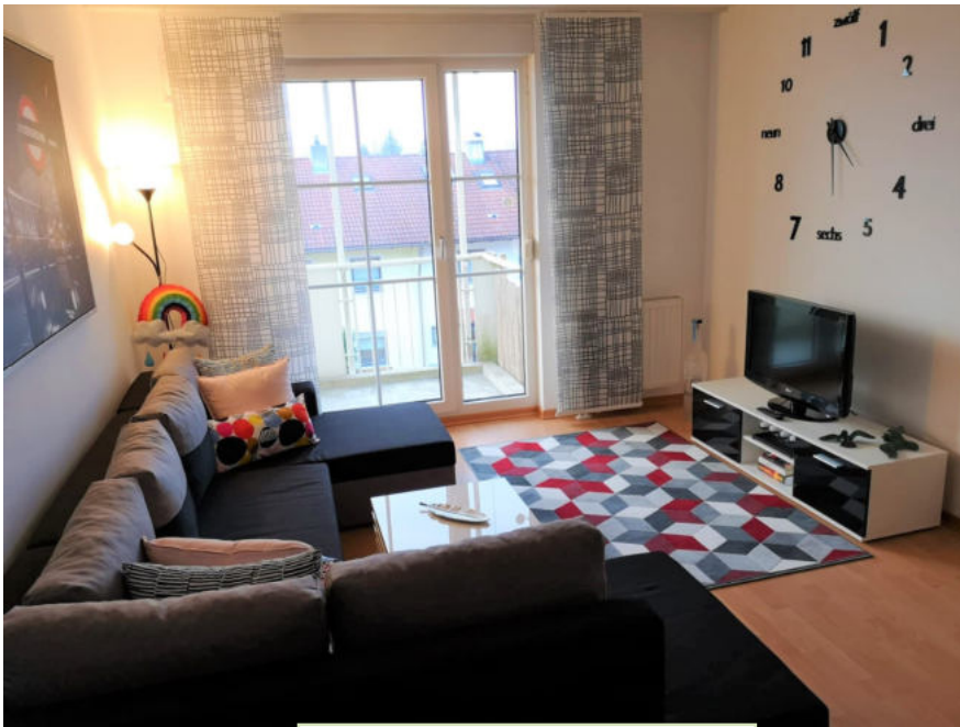
Wohn- und Esszimmer