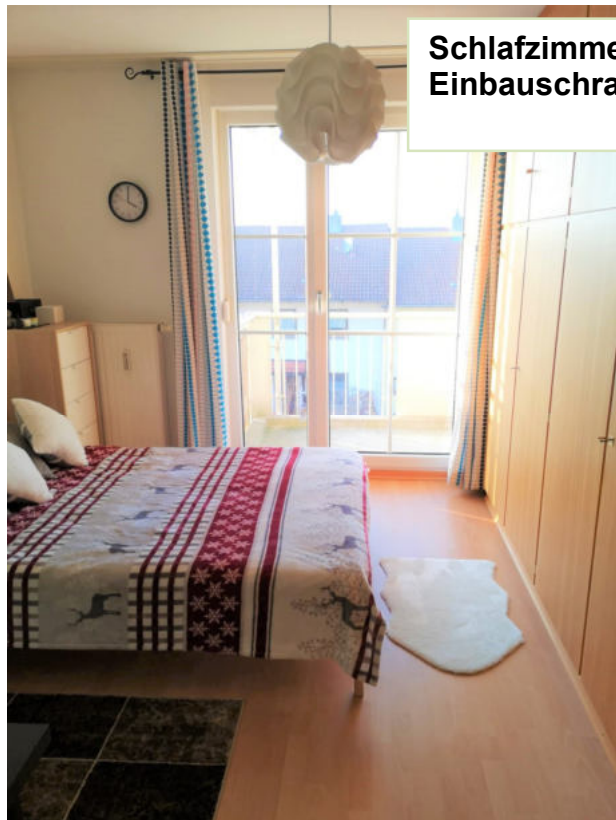
Schlafzimmer mit Einbauschränk Wohnungsflur