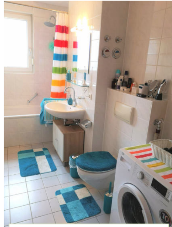
Badezimmer mit Waschmaschinenanschluss