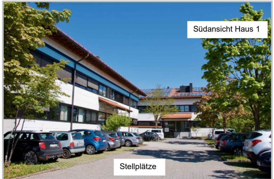
Südansicht Haus 1